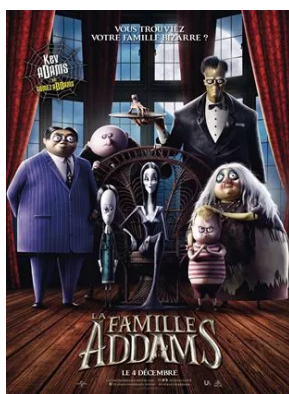
La Famille Addams