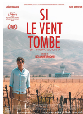
Si le vent tombe