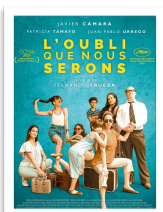
L'oubli que nous serons