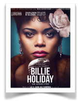
Billie Holiday, une affaire d'été